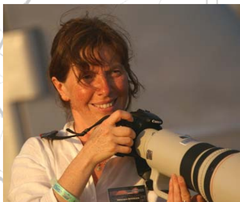
Véronique BERINGER auteur de ces douze photos

C'est désormais chose faite avec les douze vues de ce calendrier. Elles sont extraites de quelques milliers de photos et ont été prises sur plusieurs années à Oshkosh qui est un terrain de jeu pour les photographes passionnés d'aviation.